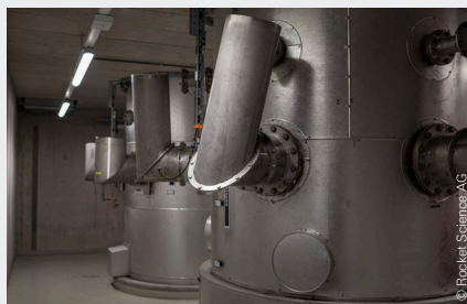
Die Kamine der Müllverbrennungsanlage.